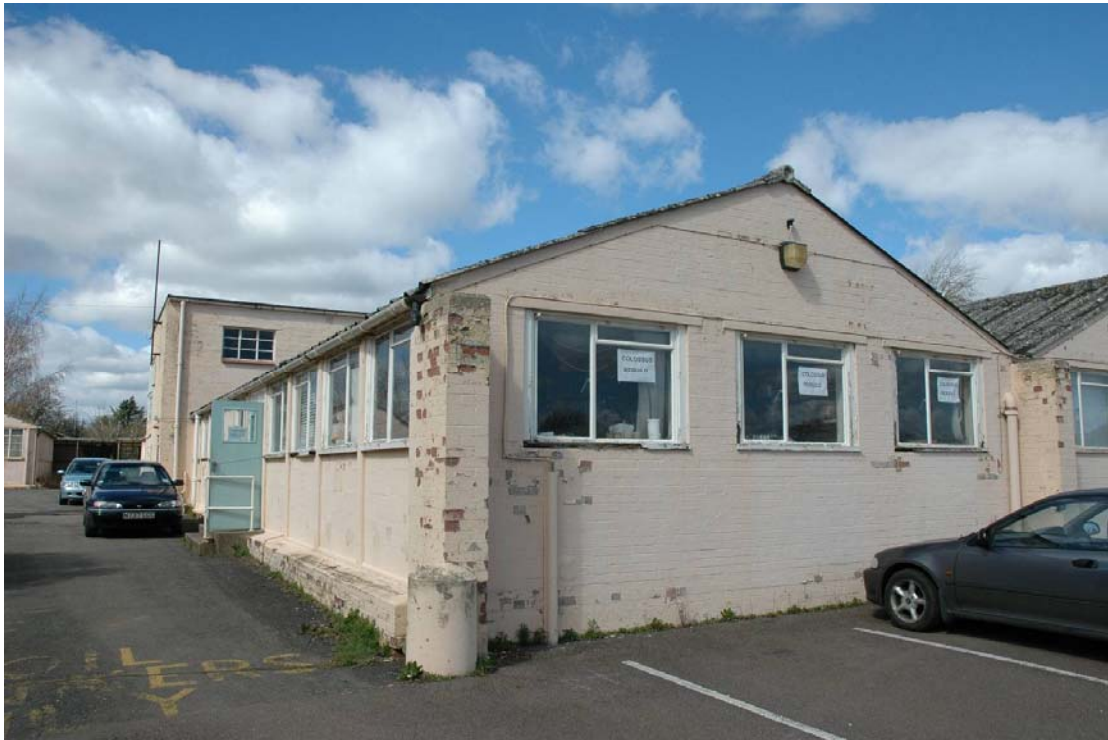
Ein einfacher Zweckbau im britischen Bletchley Park beherbergt die Colossus-Rekonstruktion: Im gleichen Gebäude stand die Originalmaschine, die während des Zweiten Weltkrieges benutzt wurde.