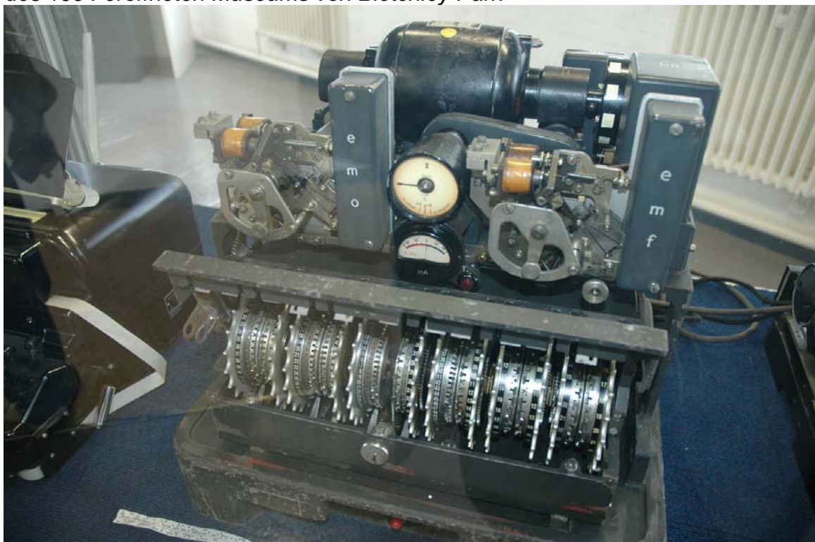
Die Lorenz Zifferzusatzmaschine SZ42. Sie diente dazu, die Signale eines Fernschreibers zu verschlüsseln.